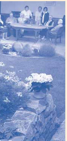
von verschiedenen Diensten, insbesondere bei allein lebenden Tagesgästen, ergänzen die Angebote der Tagespflege.

Wenn nicht immer klar orientiert, so sind die alten Menschen doch stark in ihrer Emotionalität. So können sie bei uns kostenlos einen Probetag miterleben und fühlen, ob alltägliches Leben an diesem Ort, in dieser Oase für alte Menschen im Bielefelder Süden für sie in Frage kommt.