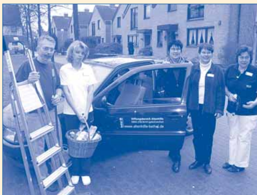
Qualifizierte Hilfen aus einer Hand - wir kommen zu Ihnen!

Immer mehr Menschen wollen auch im Alter in den "eigenen vier Wänden" leben. Doch oft können nicht alle Anforderungen des alltäglichen Lebens alleine bewerkstelligt werden. Daher gibt es nun ein neues Service-Angebot des Betheler Stiftungsbereichs Altenhilfe, das älteren Menschen in Bielefeld ein sicheres, komfortables und unabhängiges Leben zu Hause ermöglicht. Wäsche waschen, Putz- und Haushaltshilfen gehören ebenso zum Angebot des Betheler Stiftungsbereichs wie