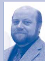
Mit freundlichen Grüßen aus der Direktion

Bei Rückfragen oder Gesprächsbedarf zu diesen Veränderungen stehen wir als Direktion Ihnen gern zur Verfügung.